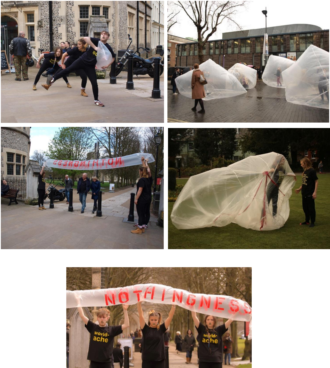
Fig. 4 a, b, c, d, e. Woosh!2016. Winchester, 23 de abril de 2016.

navegar por la ciudad. Esta cartografía inicial contenía fragmentos del libro localizados en diferentes puntos de la ciudad, cartografía que se iba enriqueciendo con líneas, trazos y textos desarrollados por los participantes del taller basados en la experiencia de los diferentes espacios.