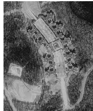
Fig. 1. Breve Historia de la Visión Comunicativa en la Arquitectura Moderna. 1.a. Union Carbide & Carbon Co. Building. Chicago 1929. 1.b. Union Carbide Building. Nueva York 1961. 1.c. Union Carbide Corporate Center. Connecticut 1983.

A la mitad de la década de los 1950s, Union Carbide Corporation encarga el proyecto de su nueva sede en Nueva York a SOM Skidmore Owings & Merrill, probablemente la oficina de