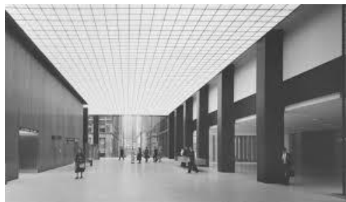
Fig. 2. Transparencia. Vestíbulo del Union Carbide Building, Nueva York 1961.