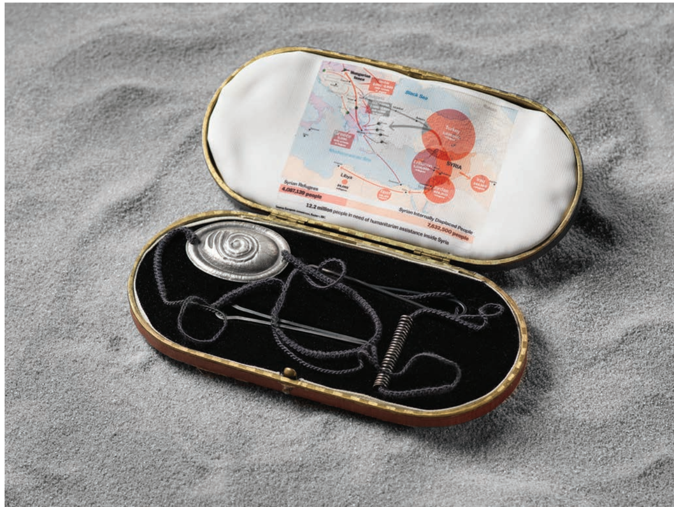
02 / No Direction Home Exodus Necklace, 2016 Silver, enamel, fabric & reconditioned case