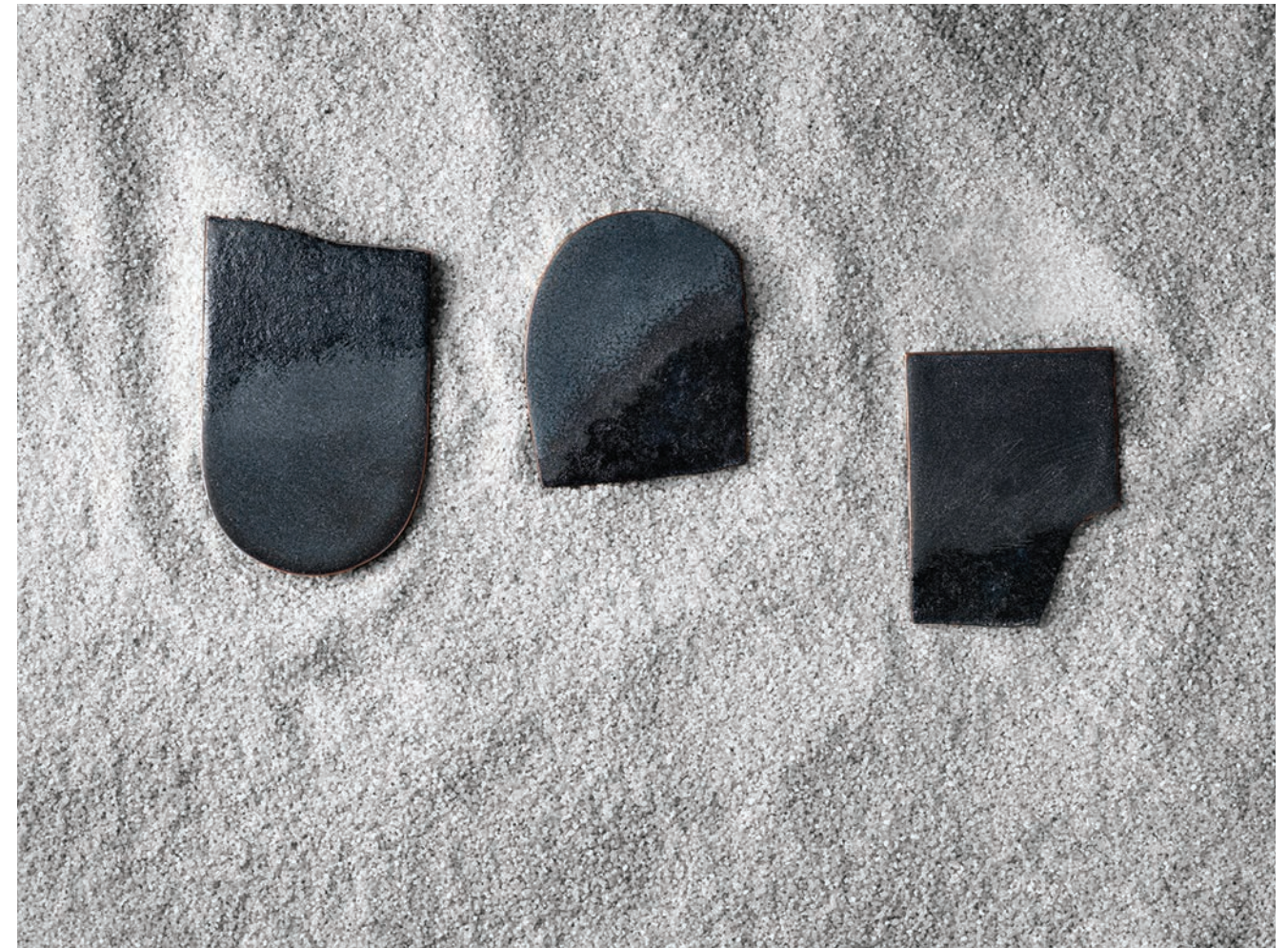
01 / Im/permanence #1, 2016 Vitreous enamel on copper, oxidized sterling silver & stainless steel