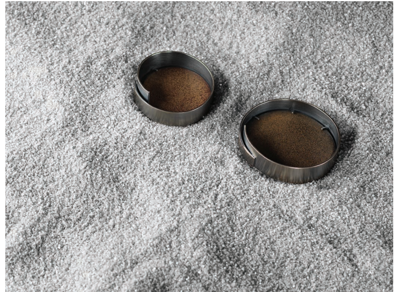
01 / Settlement # 1 2016 Material basalt, enamel & silver