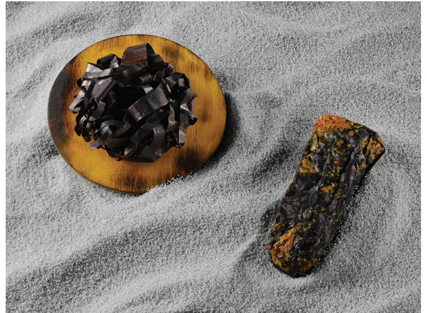
01 / Inveni Portum (I Found the Harbour), 2016 Copper, steel & acrylic paint