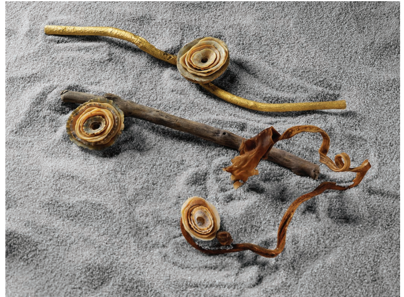
01 / Found in Translation 1, 2016 Shells & driftwood