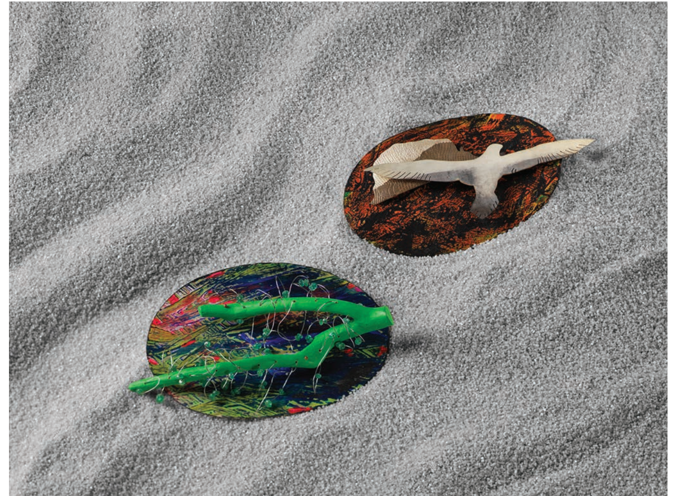
01 / Brooch, Volando, Flying, 2016 Silver, acrylic & paint