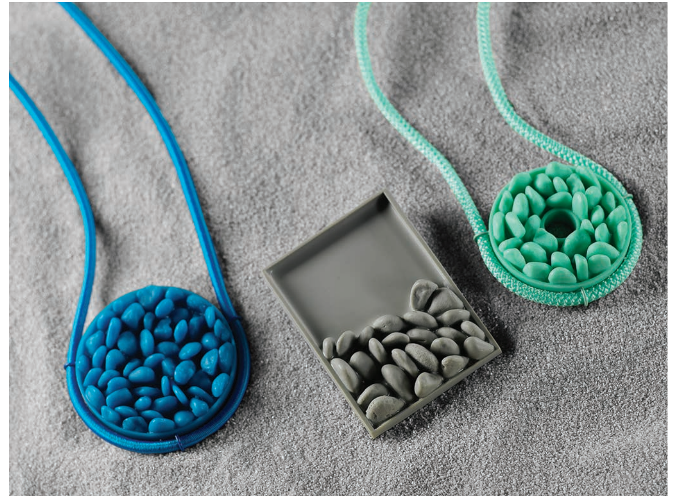
01 / Weight, 2016 Resin, nylon & powder-coated brass