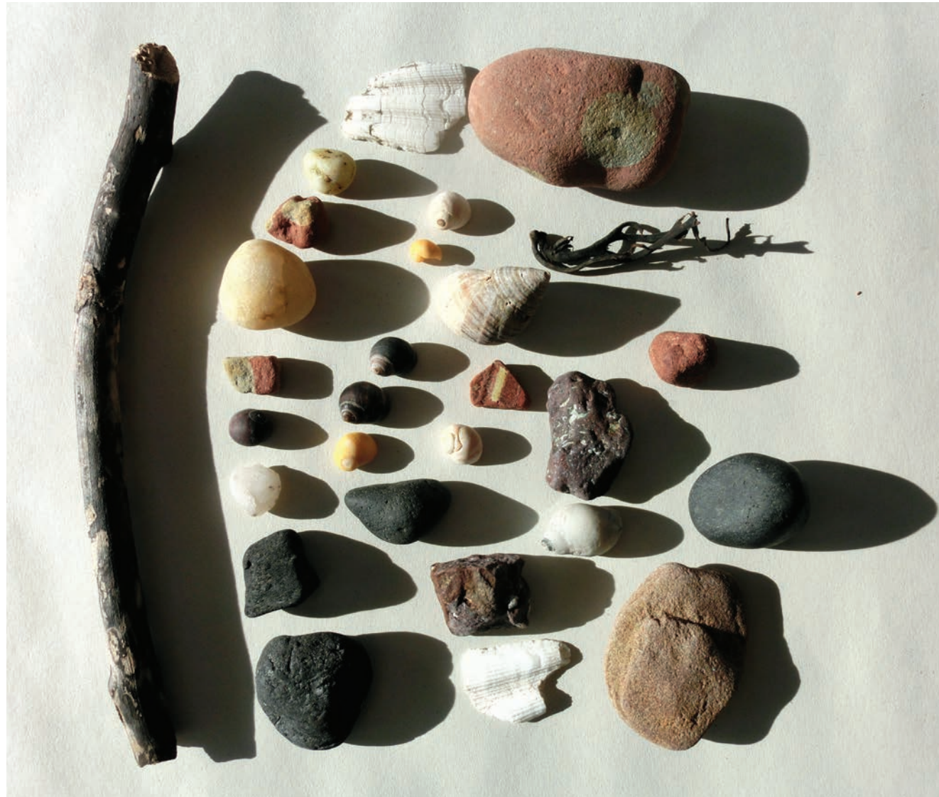
01 / Finds from North Berwick beach