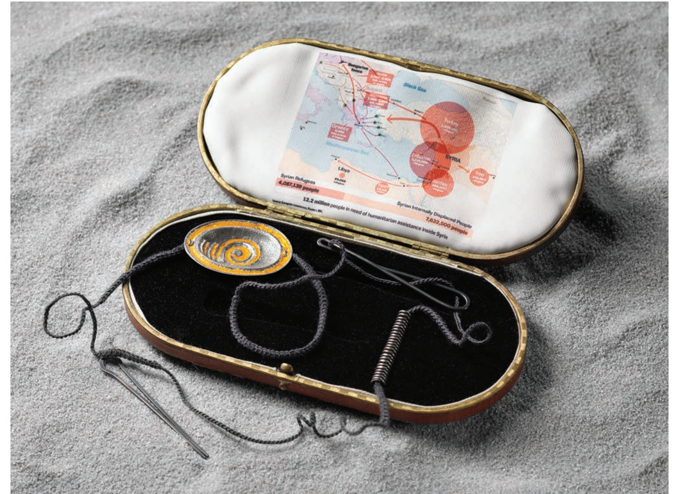
03 / No Direction Home Exodus Necklace, 2016 Silver, enamel, fabric & reconditioned case