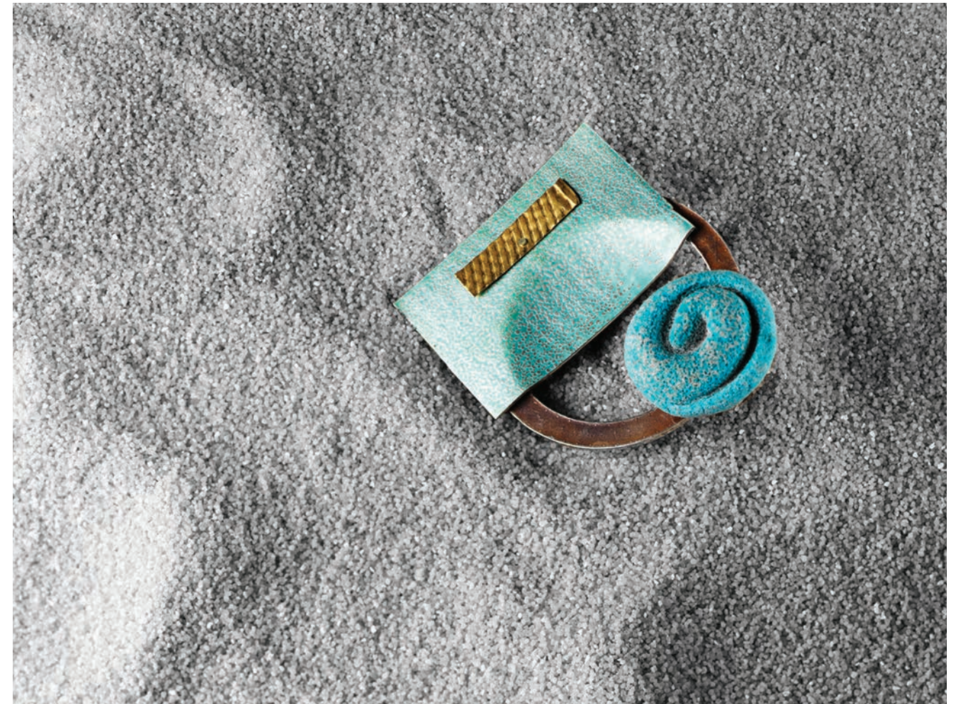
01 / King Curl Brooch, 2016 Silver, gold, enamel & Egyptian paste (Bottomley/Kelly)