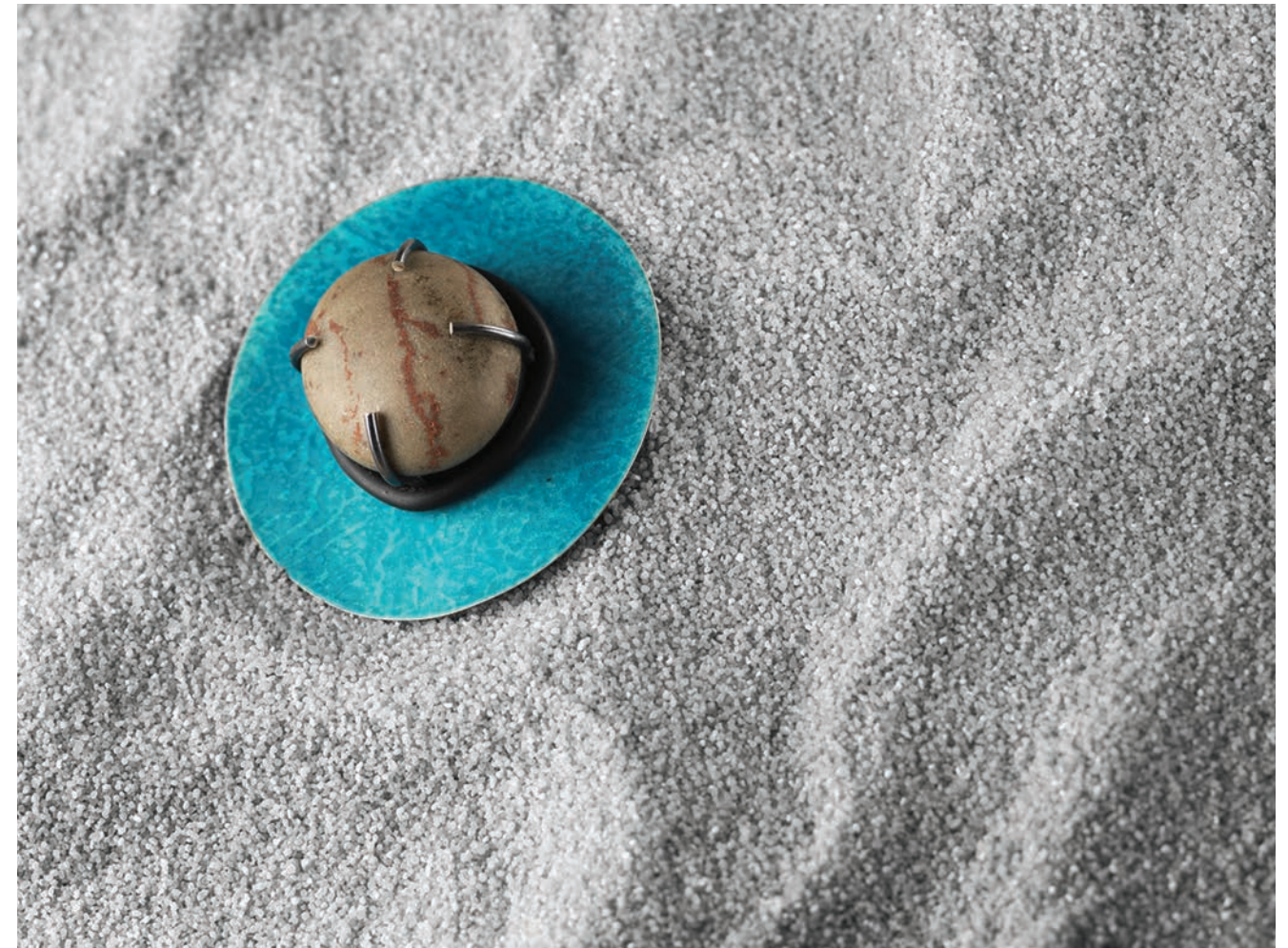
01 / A complete unknown Allochthonous Brooch, 2016 Stone, silver & enamel