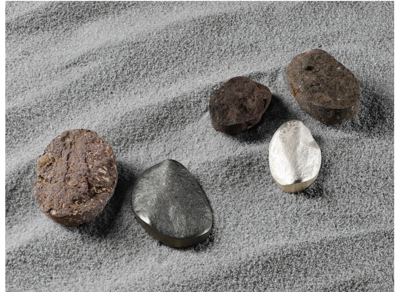
01 / Neolith 1 Oxidised silver