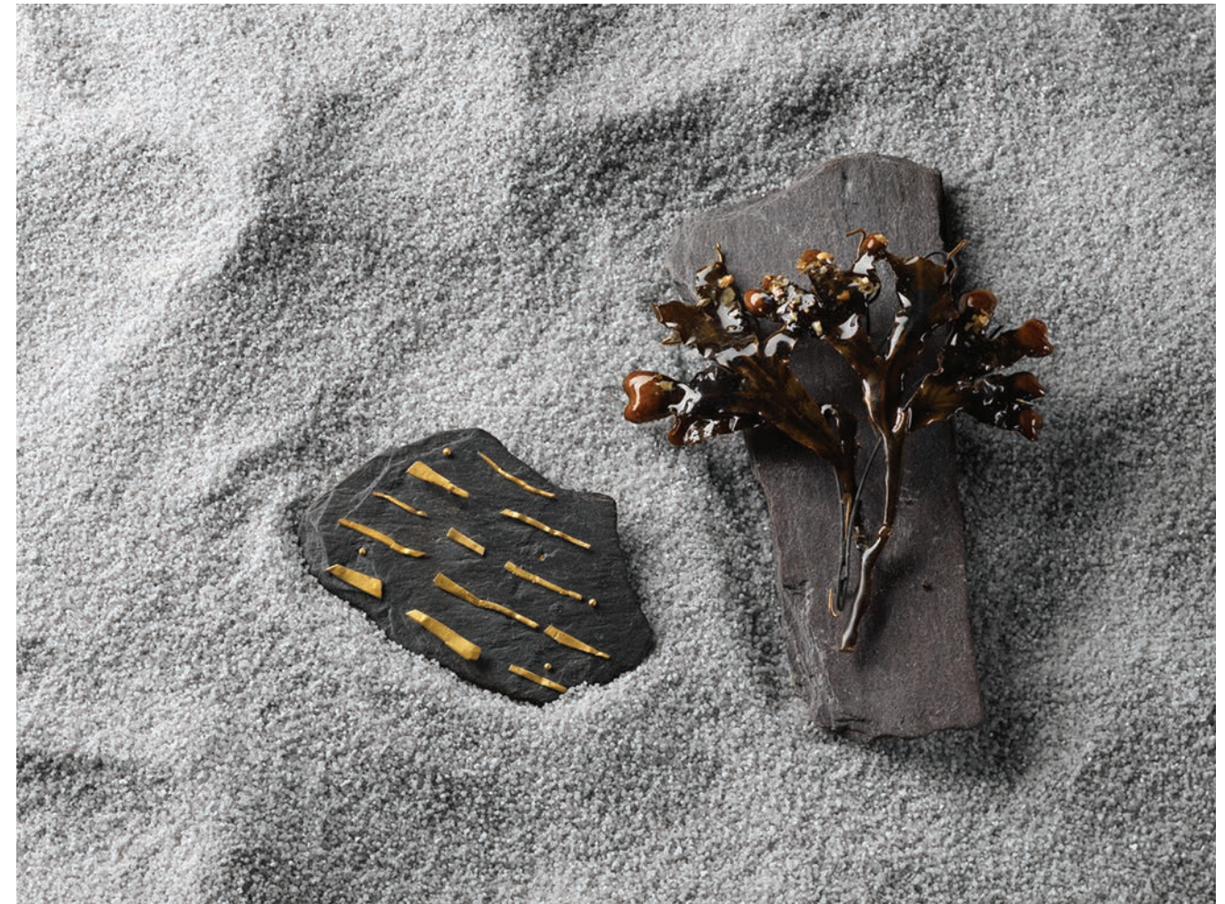
01 / Tracks brooch, 2016 Sandstone, fine gold, silver & patina